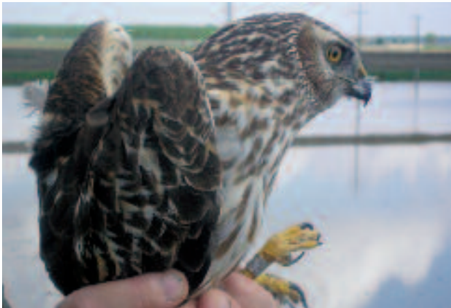
Albanella reale al momento della liberazione dopo le cure (foto archivio P.F.Po)

Sono tante le specie che trovano protezione e salvezza al C.R.F.S.P.O. gestito dal Parco