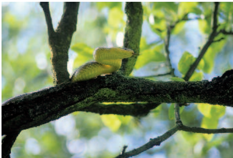
Esemplare di Saettone

Un'importante tappa è stata, nel 1993, l'entrata in vigore della "Convenzione per la diversità biologica", i cui obiettivi fondamentali sono la salvaguardia delle comunità viventi nel Pianeta Terra attraverso interventi di conservazione della biodiversità, l'utilizzo sostenibile e condiviso delle risorse naturali. Nell'aprile del 2002 i governi sottoscrittivi si sono posti l'obiettivo di raggiungere entro il 2010 una significativa riduzione della