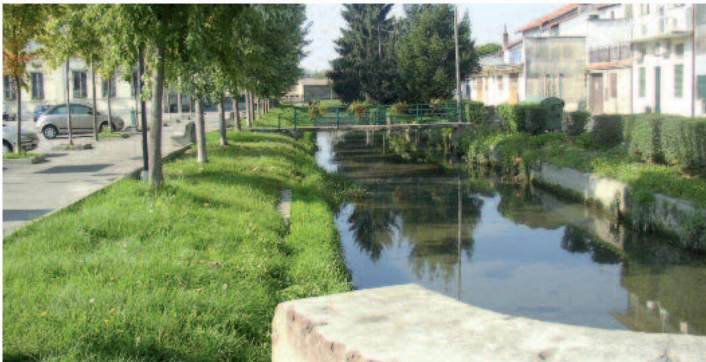
La roggia Chiusa a Fontanetto Po