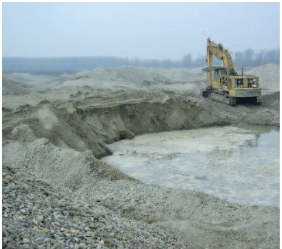
Lavori di ripristino ambientale tramite l'attività estrattiva in Località Baraccone a Casale Monferrato

Le pagine dell' InformaFiume hanno spesso ospitato notizie, informazioni e opinioni sul fenomeno, purtroppo ancora molto diffuso lungo il Po. Il Parco è impegnato da molti anni a contrastare l'attività abusiva condotta da 2-3 pastori che ostinatamente portano i propri animali a pascolare nelle aree naturali più importanti e nei periodi più delicati per l'equilibrio degli habitat, senza ovviamente chiedere le dovute autorizzazioni. Nel corso degli ultimi dieci anni, quasi ogni anno i Guardiaparco hanno denunciato all'Autorità Giudiziaria sempre gli stessi pastori per il pascolo abusivo sulle proprietà pubbliche e demaniali. Paralle-