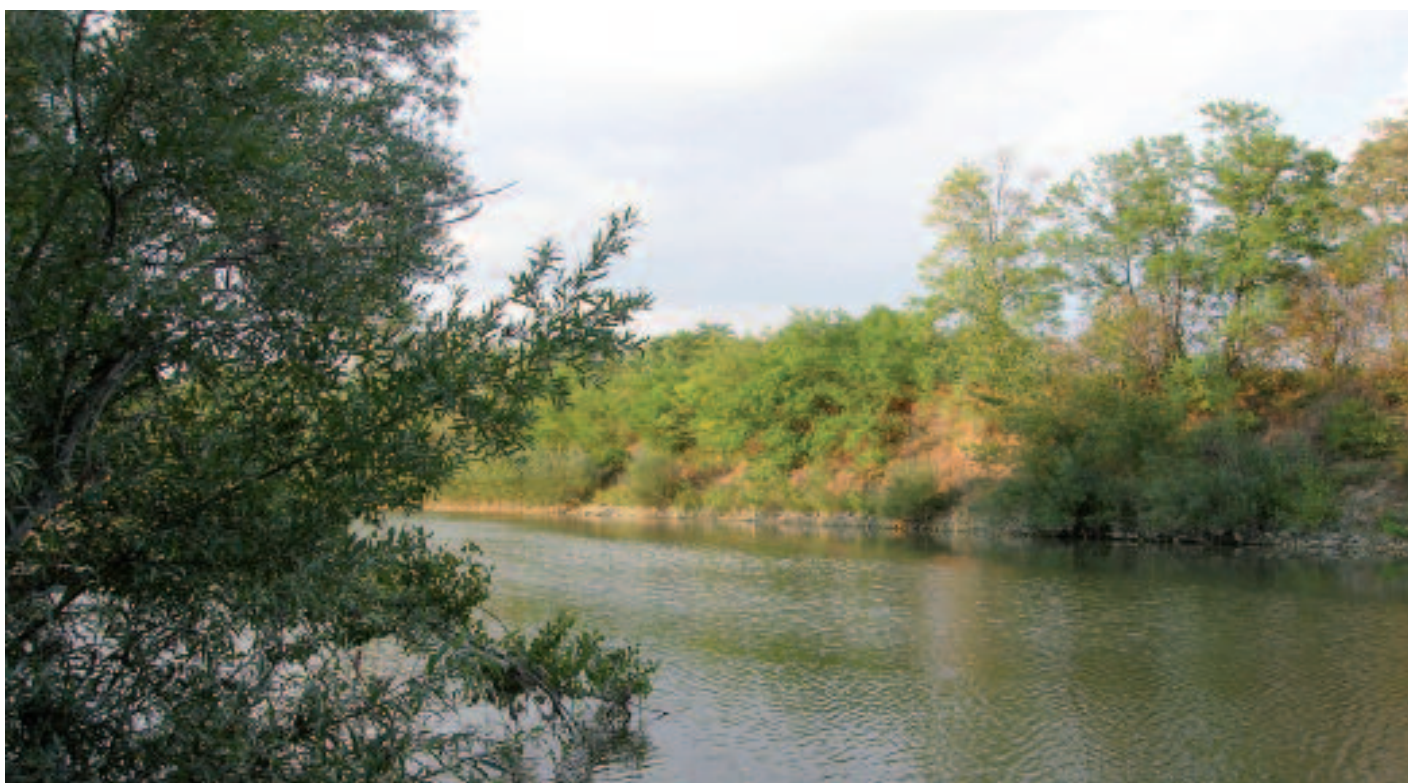
Il Torrente Orba all'altezza di Retorto