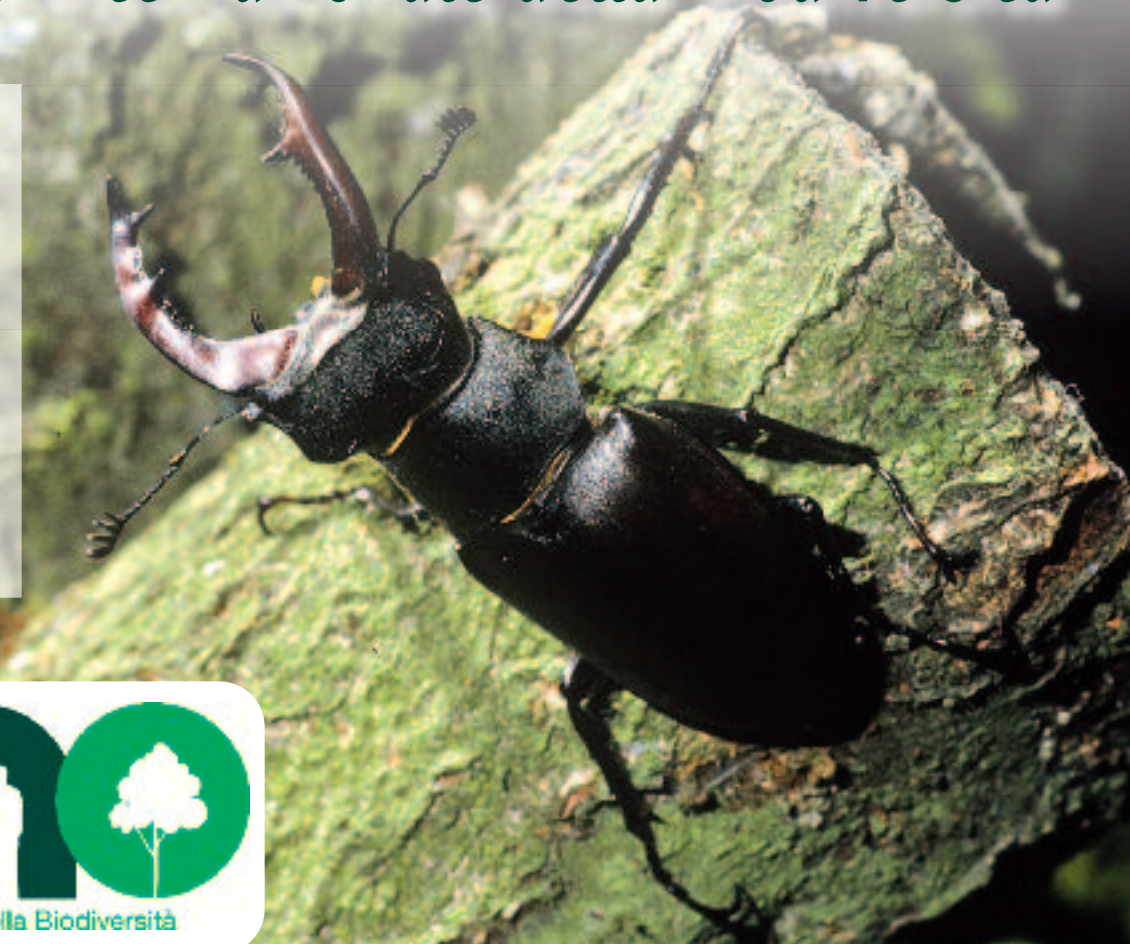
Cervo volante

L'Assemblea generale delle Nazioni Unite ha dichiarato il 2010 "Anno Internazionale della Biodiversità". Vi raccontiamo cosa significa, e quali sono le principali iniziative del Parco collegate al progetto "Countdown 2010"